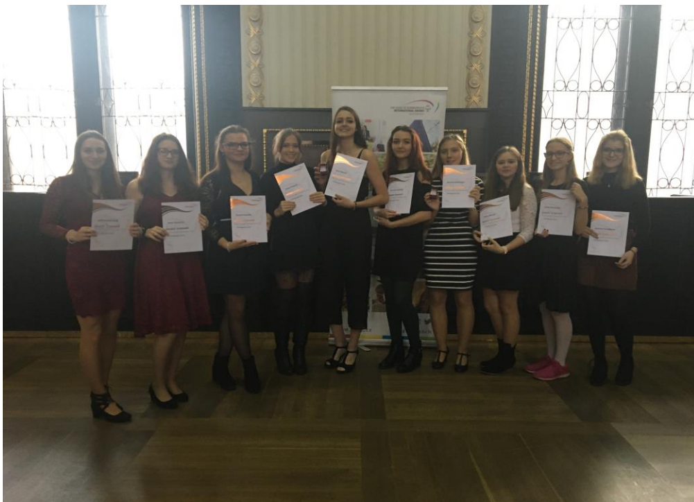
Ocenění studentek na Staroměstské radnici v Praze

osobností. V polovině prosince 2019 převzalo prvních 10 studentů, kteří již dokončili bronzovou úroveň, svá ocenění. Někteří z nich pokračují v programu a plní své aktivity na zlaté úrovni (5 studentů), dalších 5 studentů na bronzové úrovni. Se studenty u nás pracují 4 vedoucí / hodnotitelé.