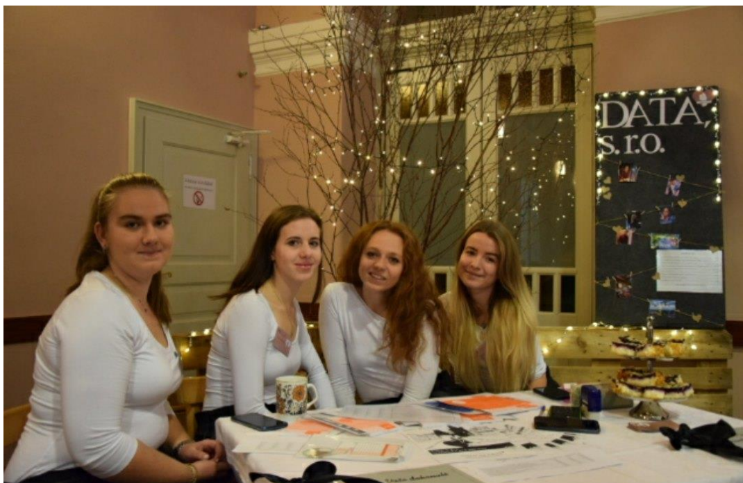
Veletrh fiktivních firem „Podzimní Příbram“ 2019

V průběhu školního roku se fiktivní firmy z naší školy zúčastnily řady dalších regionálních veletrhů.