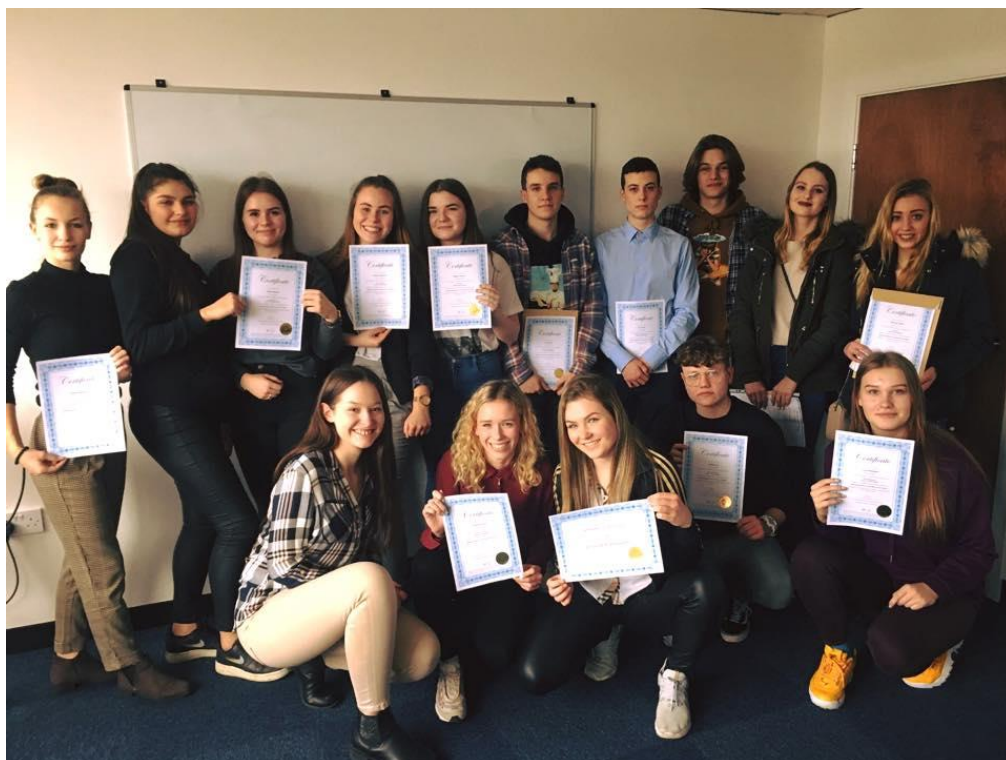
Praktikanti v Londýně 2020

Na dlouholetou spolupráci zapojených organizací (Obchodní akademie Příbram, Berufsbildende Schule Idar-Oberstein a ADC London) navázal ve školním roce 2019/2020