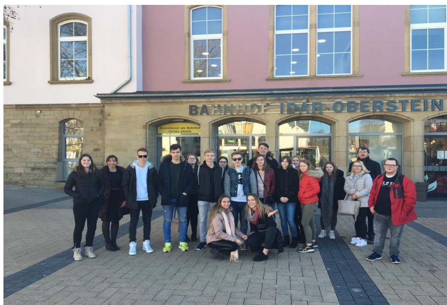
Praktikanti v Idar-Obersteinu 2019

Opět se nám to podařilo a náš projekt „Učíme se praxí v Evropě“ v rámci ERASMUS+, klíčová akce 1 byl schválen. Projekt navázal na dlouholetou spolupráci zapojených organizací (Obchodní akademie Příbram, Berufsbildende Schule Idar-Oberstein a ADC London) a jeho realizace přispěla k implementaci internacionalizační strategie školy. Tento projekt zahrnuje tři aktivity – krátkodobé stáže v podnicích, mobility profesního rozvoje pedagogických pracovníků a stáže ErasmusPro. Na dvoutýdenní odbornou stáž do Německa (6) a Velké Británie (22) vyjelo celkem 28 žáků a studentů. Tříměsíční stáže v Londýně se zúčastnila jedna absolventka VOŠ (červen–září 2018).