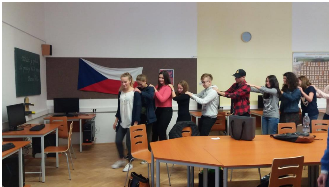
Projekt Edison 2018

V září 2018 se na naší škole uskutečnil další ročník projektu Edison, do kterého jsme se společně s Gymnáziem pod Svatou Horou zapojili již potřetí. Pod záštitou mezinárodní organizace AIESEC se studenti z celého světa mají možnost podívat do cizích zemí a na oplátku seznámí studenty hostitelských zemí se svou vlastní, tradicemi, kulturou či zvláštnostmi. Letos nás navštívilo 6 vysokoškolských studentek ze zemí bližších jako je Rumunsko a Gruzie, ale i velmi vzdálených, a to Brazílie, Číny, Indie a Kyrgyzstánu. Naši studenti mohli sledovat jejich prezentace doprovázené komentáři, osobními zážitky a zkušenostmi, vyzkoušeli si brazilskou sambu, čínské kung-fu či kyrgyzský národní tanec. Na závěr byl dán prostor dotazům a osobním pohovorům. Pro české studenty byl tento týden velmi přínosný, protože měli možnost seznámit se s odlišnými kulturami a tradicemi, porovnat různé akcenty angličtiny, navázat nová přátelství a uvědomit si, že i přes všechny rozdíly si dokážeme rozumět a vzájemně se obohatit.